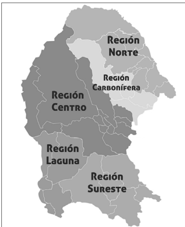
Regiones geográficas de Coahuila (Secretaría del Medio Ambiente, 2013).

Para contextualizar el territorio donde se gesta el tema del siguiente apartado, se expone que Coahuila representa el 7.7% de extensión territorial con respecto al total nacional, y es la tercera entidad con mayor extensión. Limita al norte con los Estados Unidos de América; al oriente con el estado de Nuevo León; al sur con los estados de San Luis Potosí, Zacatecas y Durango, y al poniente con Durango y Chihuahua. Tiene 38 municipios y 9,983 localidades urbanas y rurales (INEGI, 2017a), agrupados en cinco regiones geográficas: Norte, Carbonífera, Centro, Sureste y Laguna.